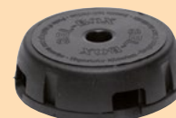
EROGATORE ESCA IN GEL